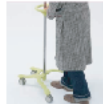
支柱に近づきやすい脚部デザイン

輸液等を吊り下げるフック部は、輸液を吊り下げ易く、カーテン等にも引っ掛りにくい形状を採用。