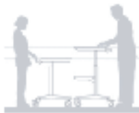
天板の高さを調節可能