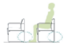
下肢空間が広く、掃除も容易